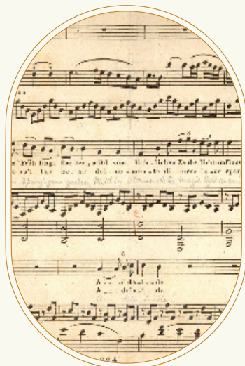
La Sinfonía n.º 9 en re menor "Coral"

El poema de Friedrich Schiller An die Freude (noviembre de 1785), traducido como A la alegría, y conocido como Oda a la alegría que Schiller publicó en 1786, provocó en Beethoven la intención de musicalizarlo ya desde 1793 cuando tenía 22 años.