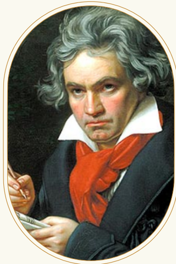
Retrato de Beethoven hecho en 1820